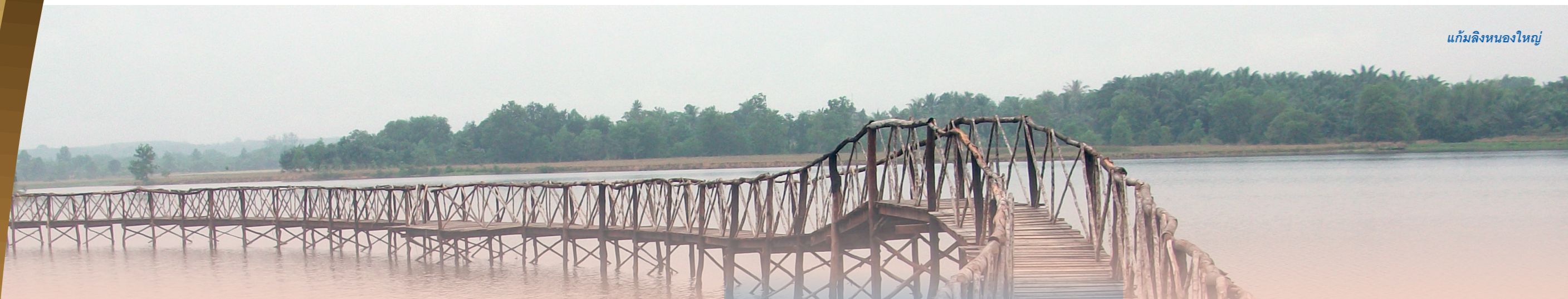
แก้มลิงหนองใหญ่