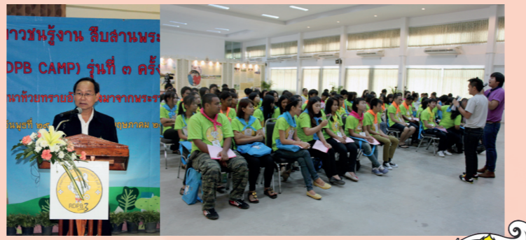
ค่ายเยาวชน สืบสานพระราชดำริ RDPB CAMP รุ่นที่ ๓ ครั้งที่ ๖

การสร้างความรู้เกี่ยวกับแนวพระราชดำริสู่สังคมนั้น สำนักงาน กปร. ได้เล็งเป้าหมายที่เยาวชนด้วยเช่นกัน สำนักงาน กปร. ได้จัดกิจกรรมชื่อโครงการค่ายเยาวชนรู้งานสืบสานพระราชดำริ (RDPB CAMP) เป็นประจำ โดยเมื่อวันที่ ๑๐ ธันวาคม ๒๕๕๖ มีการจัด RDPB CAMP รุ่นที่ ๓ ครั้งที่ ๖ ร่วมกับศูนย์ศึกษาการพัฒนา ห้วยฮ่องไคร้ฯ ณ จังหวัดเชียงใหม่ โดยผมได้ให้ความรู้กับเยาวชนเกี่ยวกับ การดำเนินงานสนองพระราชดำริให้แก่เยาวชนในภาคเหนือประมาณ ๔๕ คน โดยเยาวชนเหล่านี้ จะมาพัก